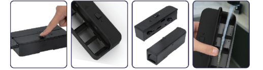
Tænd for kontakten