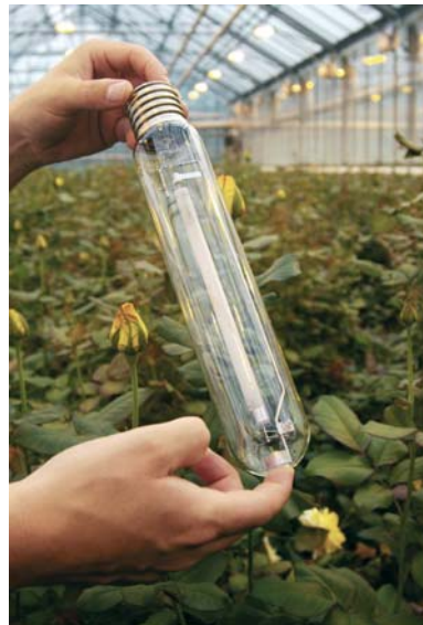
GE Lucalox™ XO PSL

Enza Zadenilla on tytäryritykset 17 maassa. Niissä maissa, joissa Enza Zadenilla ei ole omaa toimipistettä, yritys toimii paikallisten edustajiensa kautta. Suomessa yhteistyötä on jo pitkään tehty Scheteligin kanssa.