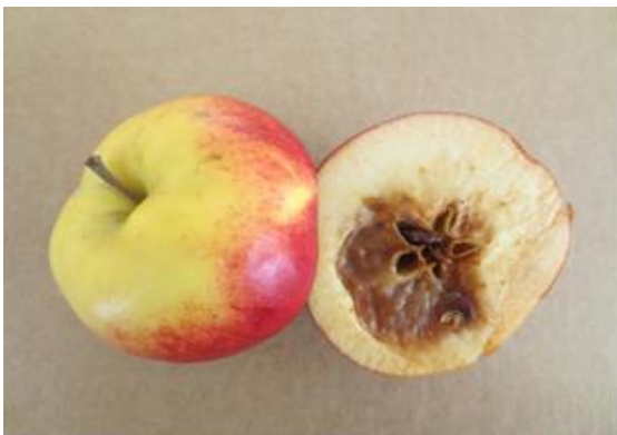
Siemenkotamädän oireita Santana-lajikkeella

Prestop Mix on saatavilla 1 kg ja 400 g pakkauksissa. Tuote säilyy avaamattomana 12 kk viileässä ja kuivassa, alle +8°C. Avattu pakkaus säilyy uudelleen suljettuna 1 kk ajan alle +8°C.